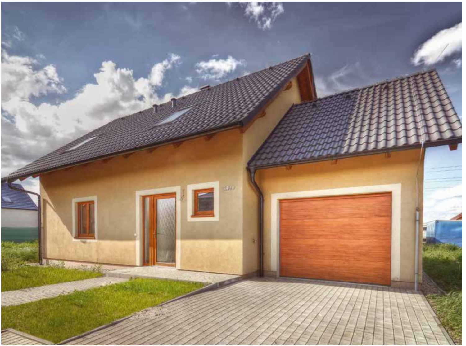
VEXTA 130 G | Šestajovice