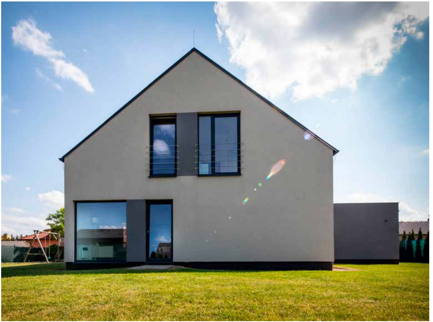
VEXTA 149 TREND G | Šestajovice