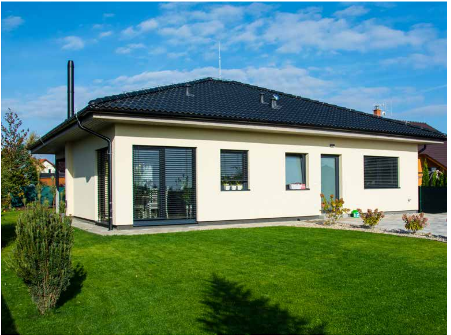
VEXTA B92 | Šestajovice